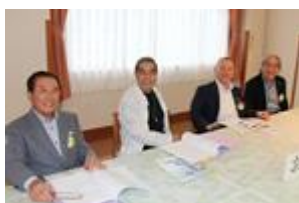
会員選考職業分類