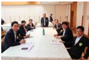
会長・直前会長・副会長・ 幹事・副幹事・会計・SAA