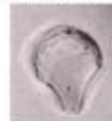
イネ属微動細胞珪酸体